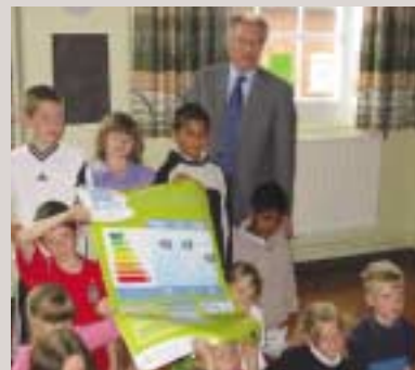
Les enfants de la Wyvern School brandissent leur certificat de consommation d'énergie

L'une des premières mesures qu'une collectivité locale peut adopter pour lutter contre le changement climatique est de contrôler et d'évaluer sa consommation énergétique. La campagne Energie-Cités DISPLAY aide les collectivités locales et les bâtiments municipaux à calculer leur consommation d'énergie. Elle les encourage également à afficher de façon conviviale les données relatives à leur consommation d'énergie dans les bâtiments publics pour contribuer à une prise de conscience de l'efficacité énergétique. Plus de 850 bâtiments publics sont déjà concernés.